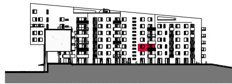
4. NADZEMNÍ PODLAŽÍ